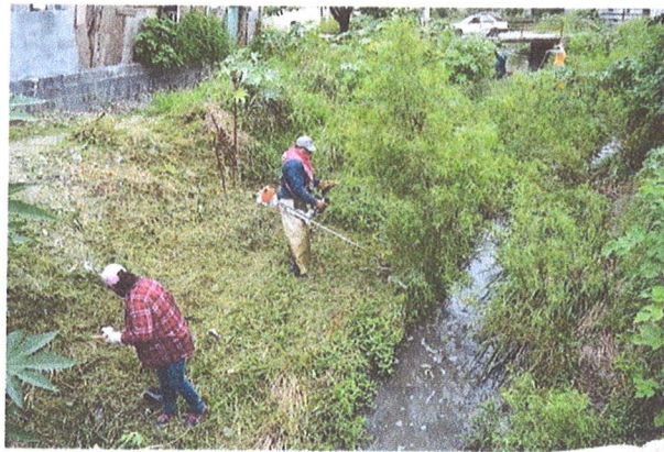
LIBERAN Trabajadores municipales limpiaron los arroyos ue cruzan por Villas de Oriente, Los Reyes, Monteverde, Villas de la Hacienda y Santa Mónica, para evitar inundaciones.

A la par tambien se brinda mantenimiento a camellones y limpieza en calles y avenidas con el retiro de algunos objetos que puedan obstruir y entorpecer el flujo vehicular. La Administración Municipal 2018-2021 continúa trabajando en el tema de los servicios públicos y pide a la comunidad juarense colabore cuidando los espacios públicos y no tirando basura a las corrientes de agua.